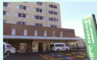
病院入口に隣接する駐車場

2013年、東京ほくと医療生活協同組合王子生協病院は、新病院として新たな活動を開始しました。「いのちの平等 これからも地域とともに」をめざし、病院に来られる方だけでなく、「地域の主治医」・「生涯の主治医」として、地域の方々との繋がりを深め、地域に根ざした医療活動を展開していきます。ベッド数も増床し、個室でも差額ベッド代をとらない無差別・平等の医療を行い、地域まるごと健康づくりを実現していきます。